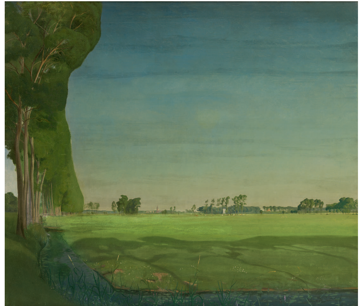
Valerius de Saedeleer Le rideau d'arbres - Landschap met dreef