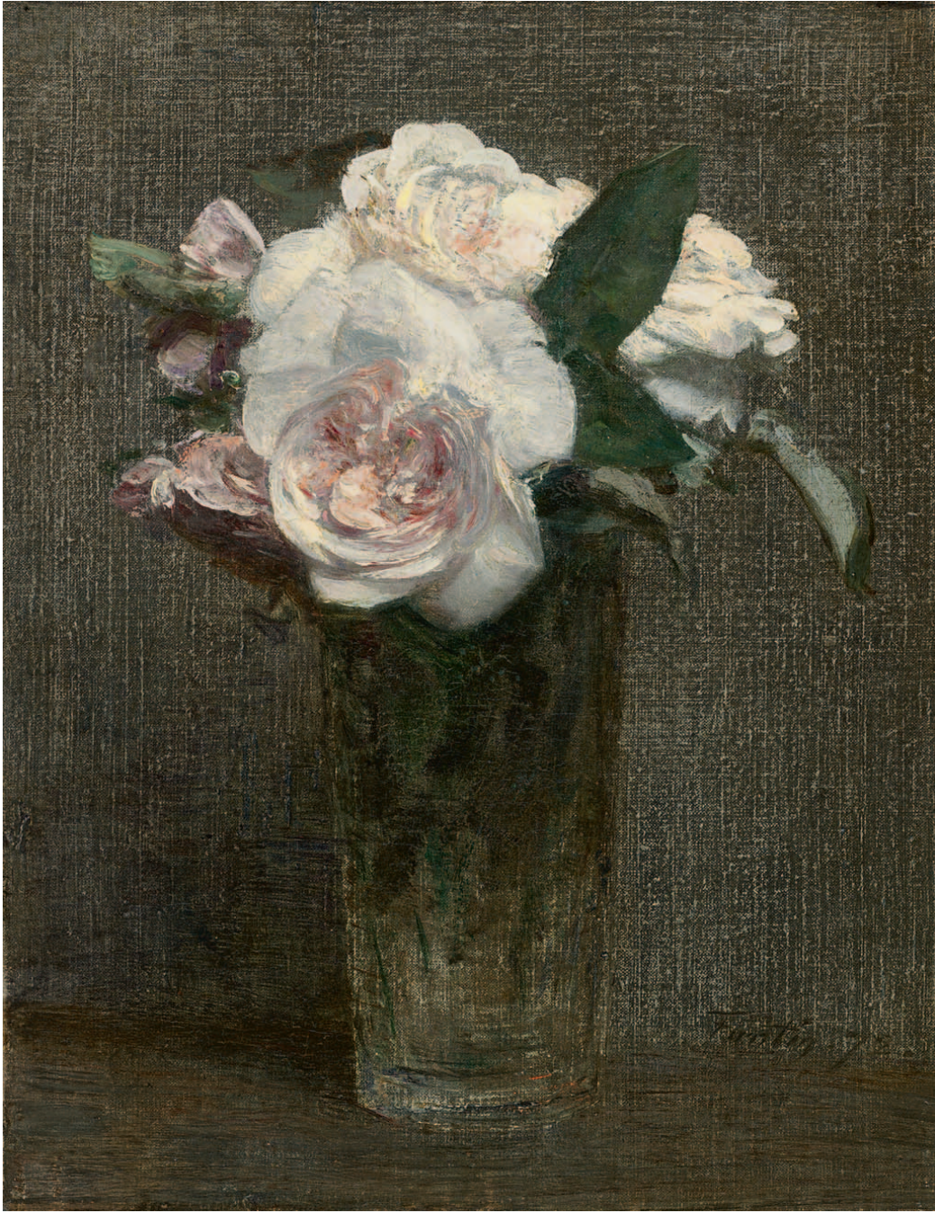
Ignace 'Henri' Jean Théodore Fantin-Latour Rozen in recht glas