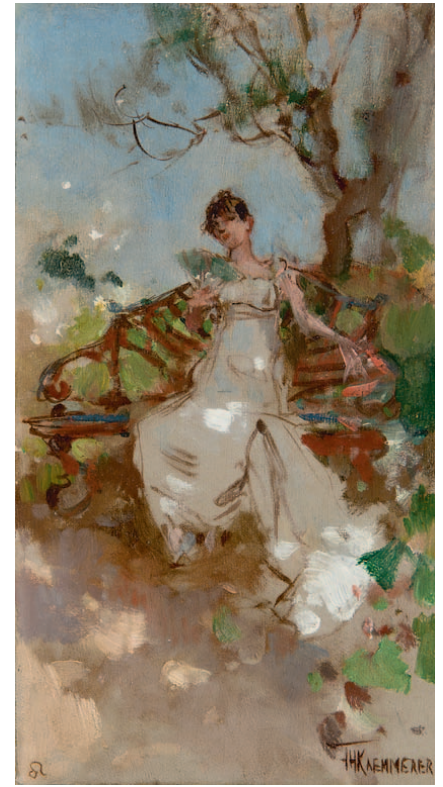
AUGUSTUS – sterrenbeeld Leeuw