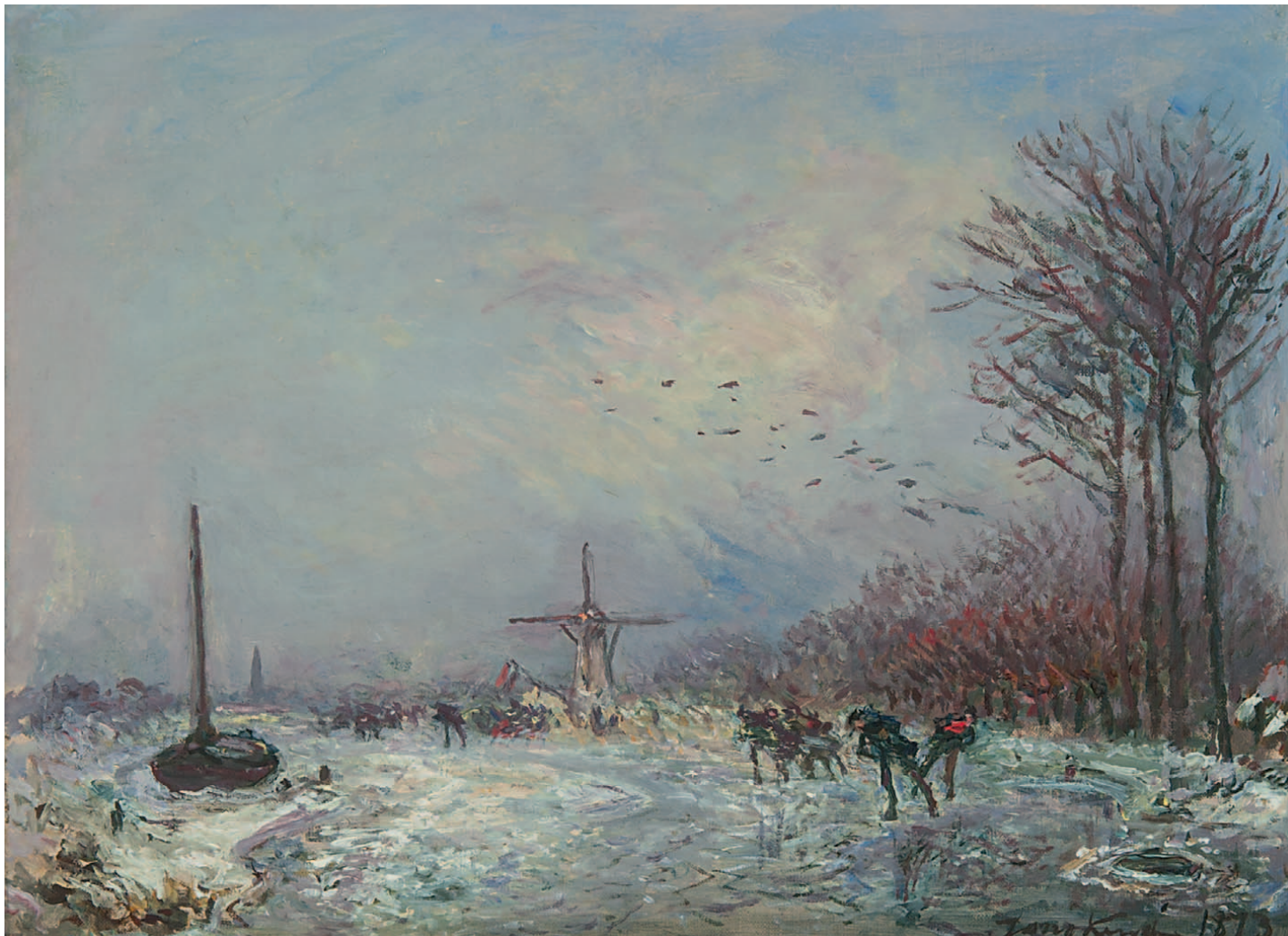
Johan Barthold Jongkind Hollandse vaart met schaatsers