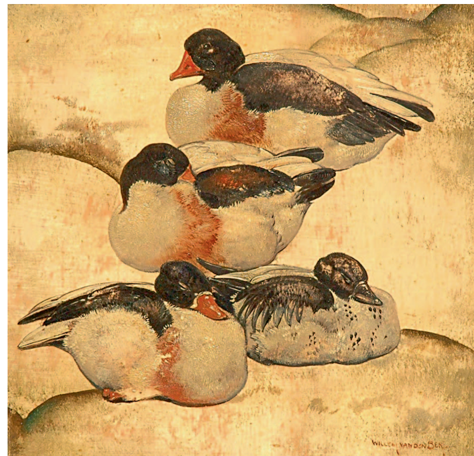
'Willem' Hendrik van den Berg Vier eenden