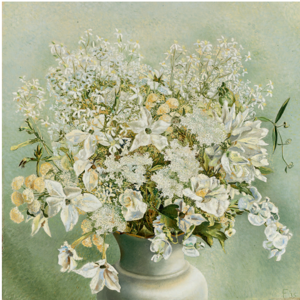
'Edgar' Richard Johannes Fernhout Boeket wilde bloemen

'De Jan Mankes van de Vlaamse schilderkunst.'