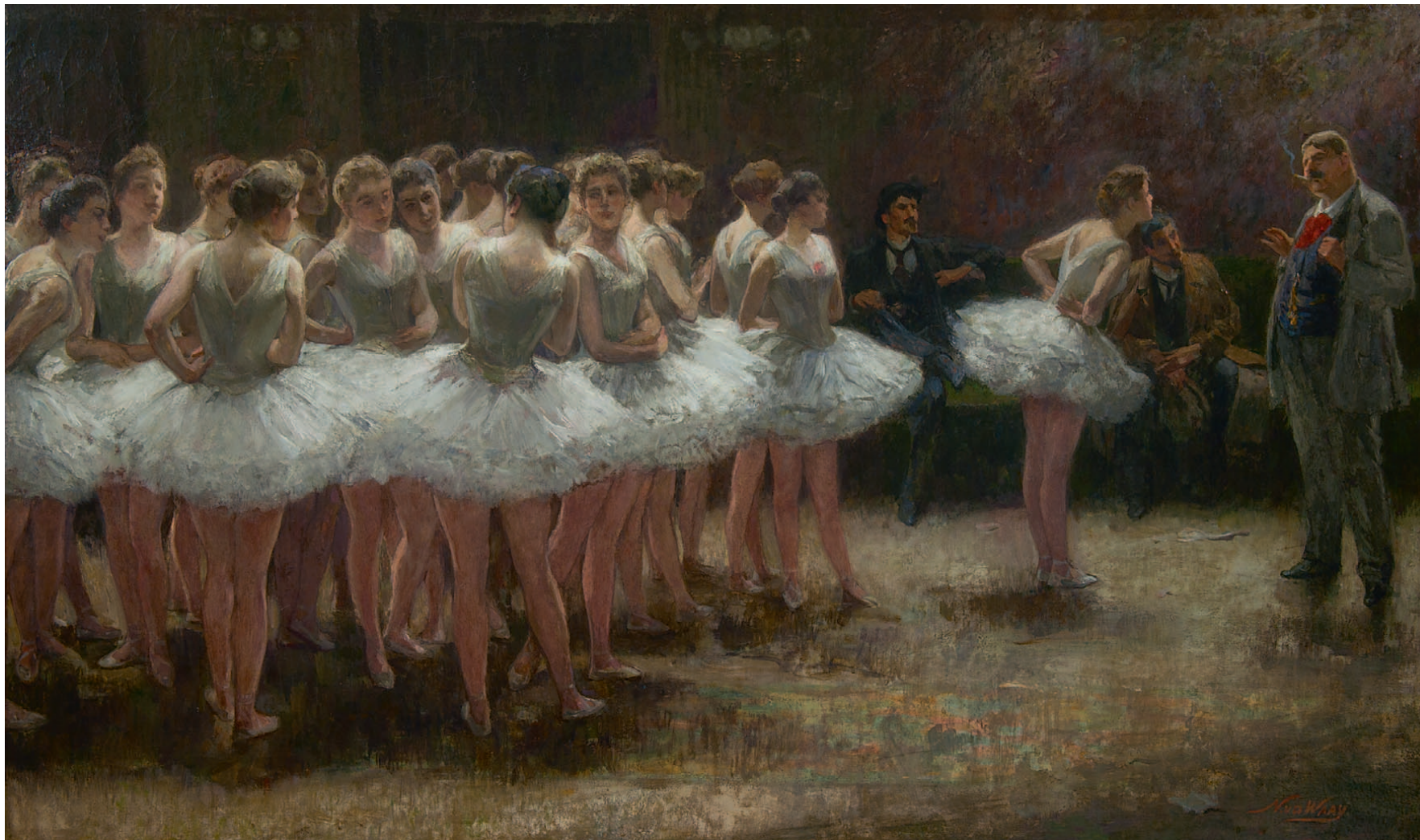
Nicolaas van der Waay Een werkstaking

'We hebben ook de voorstudie van dit schilderij, net zo'n sterk werk.'