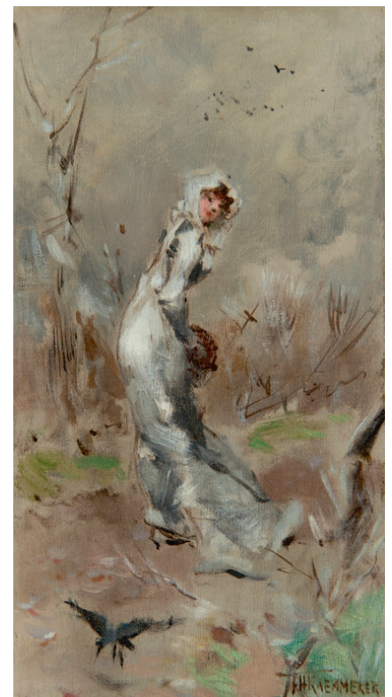
DECEMBER – sterrenbeeld Boogschutter