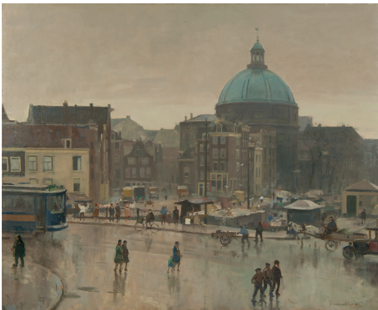
Cornelis Vreedenburgh De Prins Hendrikkade, Amsterdam, met op de achtergrond de Stromarkt en de Koepelkerk

'We hebben ook de voorstudie van dit schilderij, net zo'n sterk werk.'