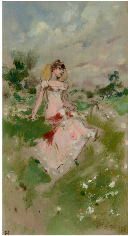
JUNI – sterrenbeeld Tweeling