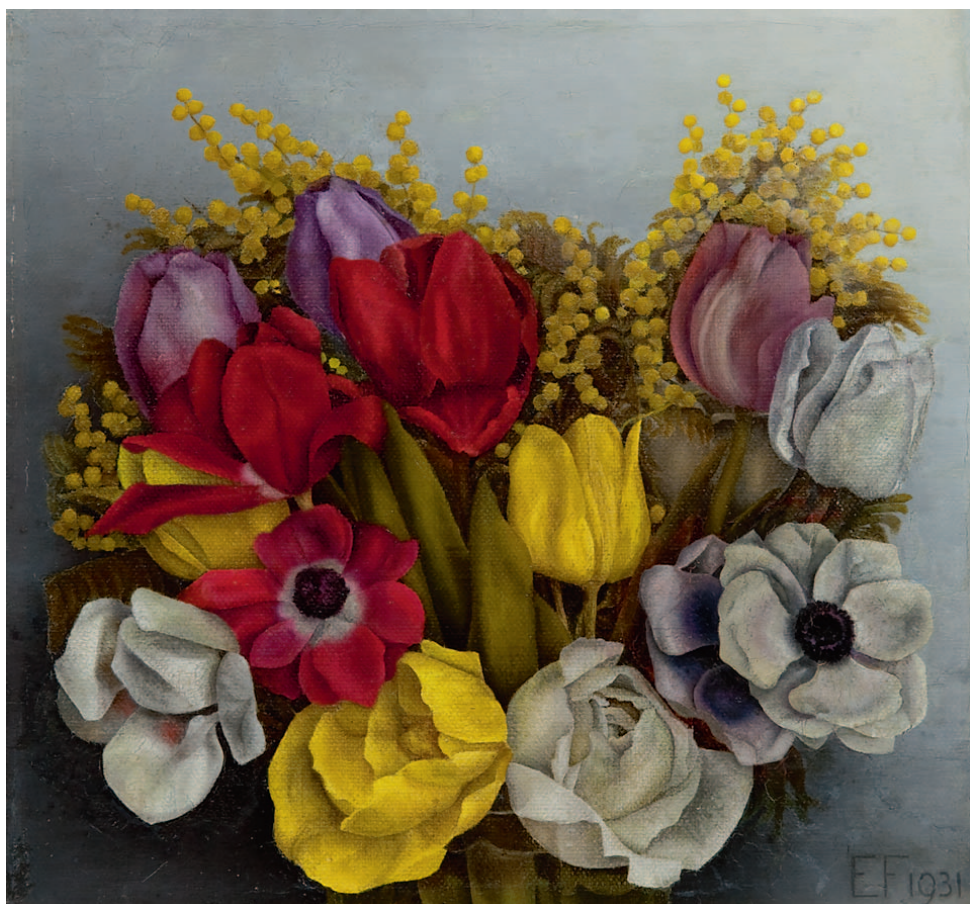
'Edgar' Richard Johannes Fernhout Lenteboeket met mimosa