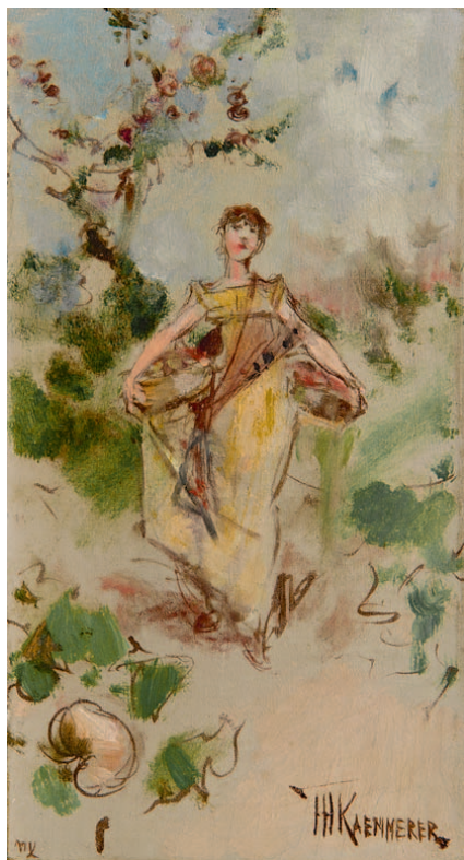
SEPTEMBER – sterrenbeeld Maagd