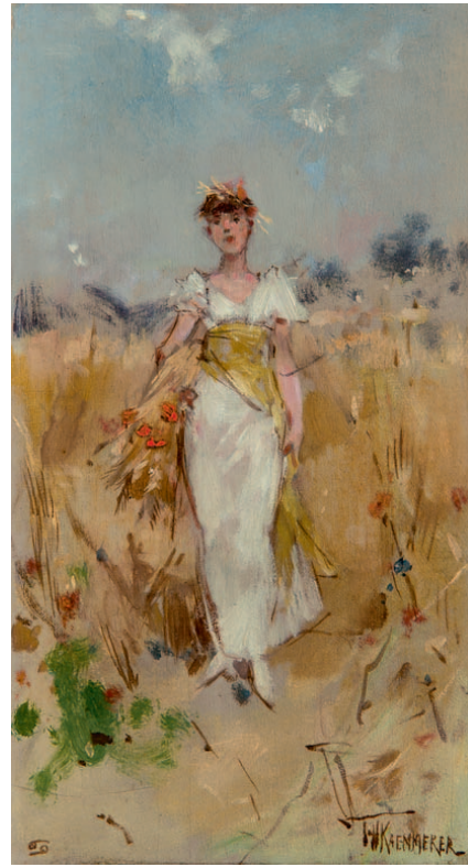
JULI – sterrenbeeld Kreeft