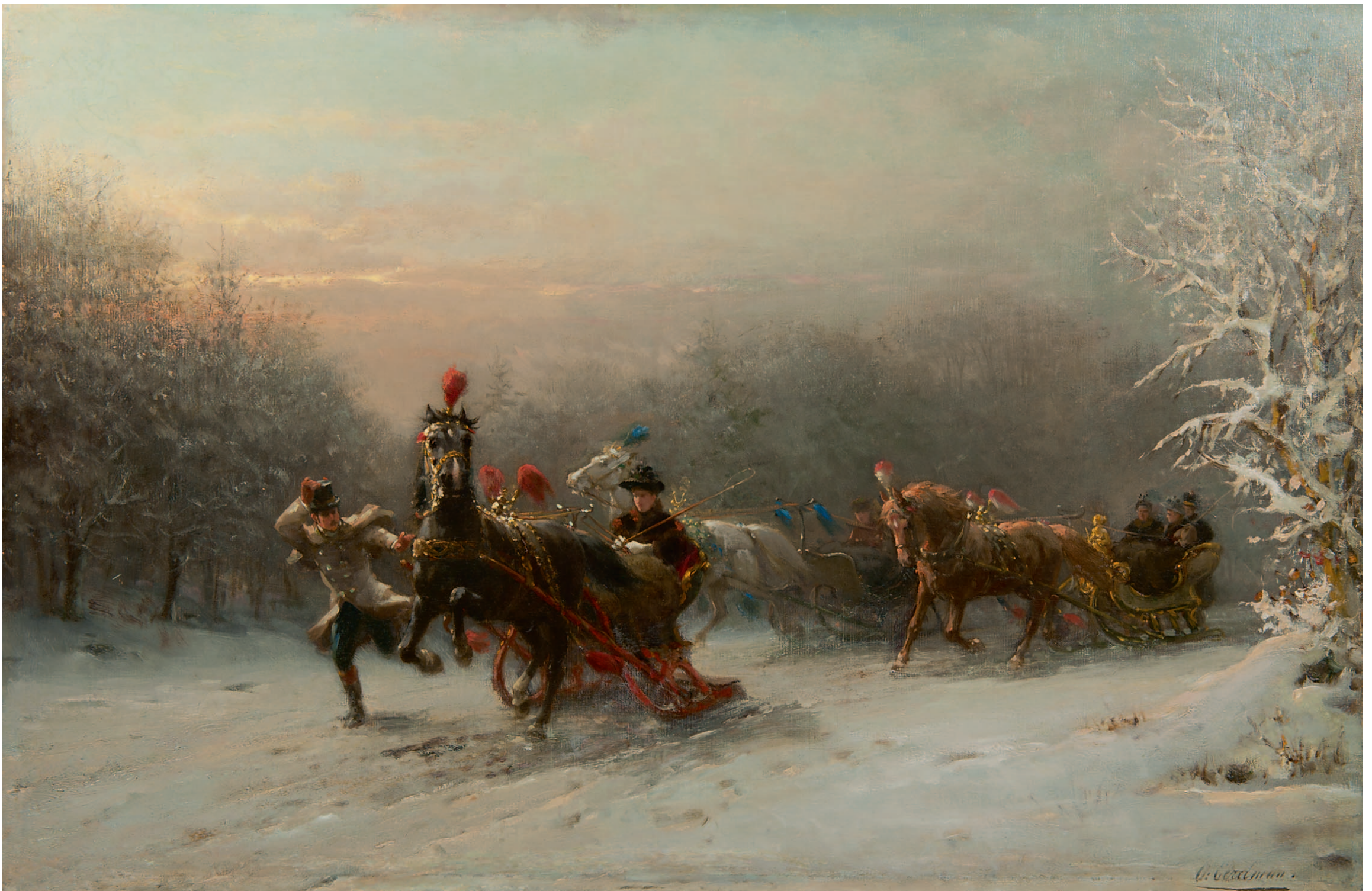
Otto Eerelman De arreslederit

'Deze juwelen van Fantin-Latour, een van 's werelds beste 19 e -eeuwse stillevenschilders, laten zich prima vergelijken met het Stilleven van hagendoorn en seringen uit het Kröller-Müller Museum.'