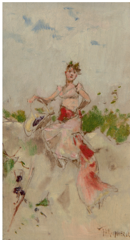
OKTOBER – sterrenbeeld Weegschaal