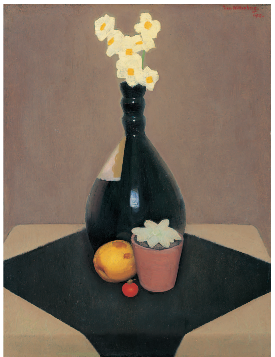
'Jan' Hendrik Willem Wittenberg Stilleven van fles met narcissen

'Twijfelgevallen bestaan niet. Het zijn alleen de mensen – zelfs experts – die twijfelen. Wèl dat een schilderij geen A-B-C'tje is.'