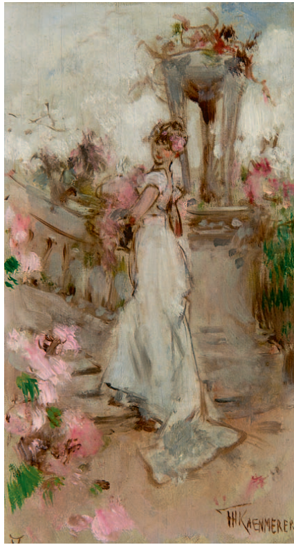
MEI – sterrenbeeld Stier