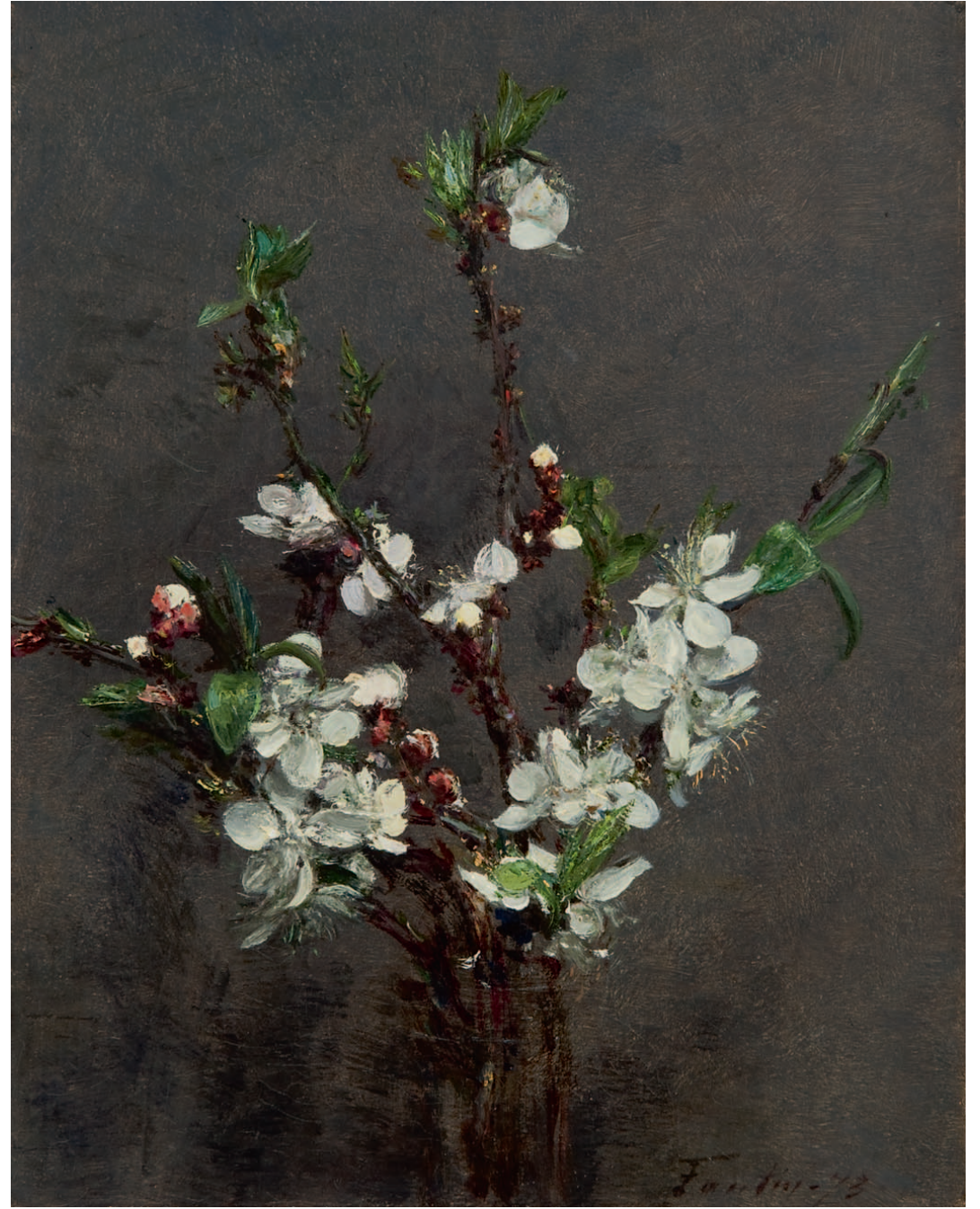
Ignace 'Henri' Jean Théodore Fantin-Latour Bloesemtakken

'Deze juwelen van Fantin-Latour, een van 's werelds beste 19 e -eeuwse stillevenschilders, laten zich prima vergelijken met het Stilleven van hagendoorn en seringen uit het Kröller-Müller Museum.'