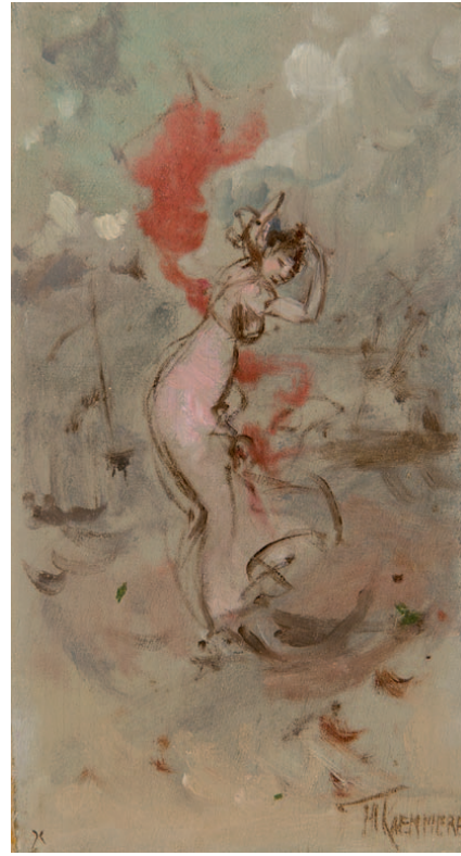
MAART – sterrenbeeld Vissen