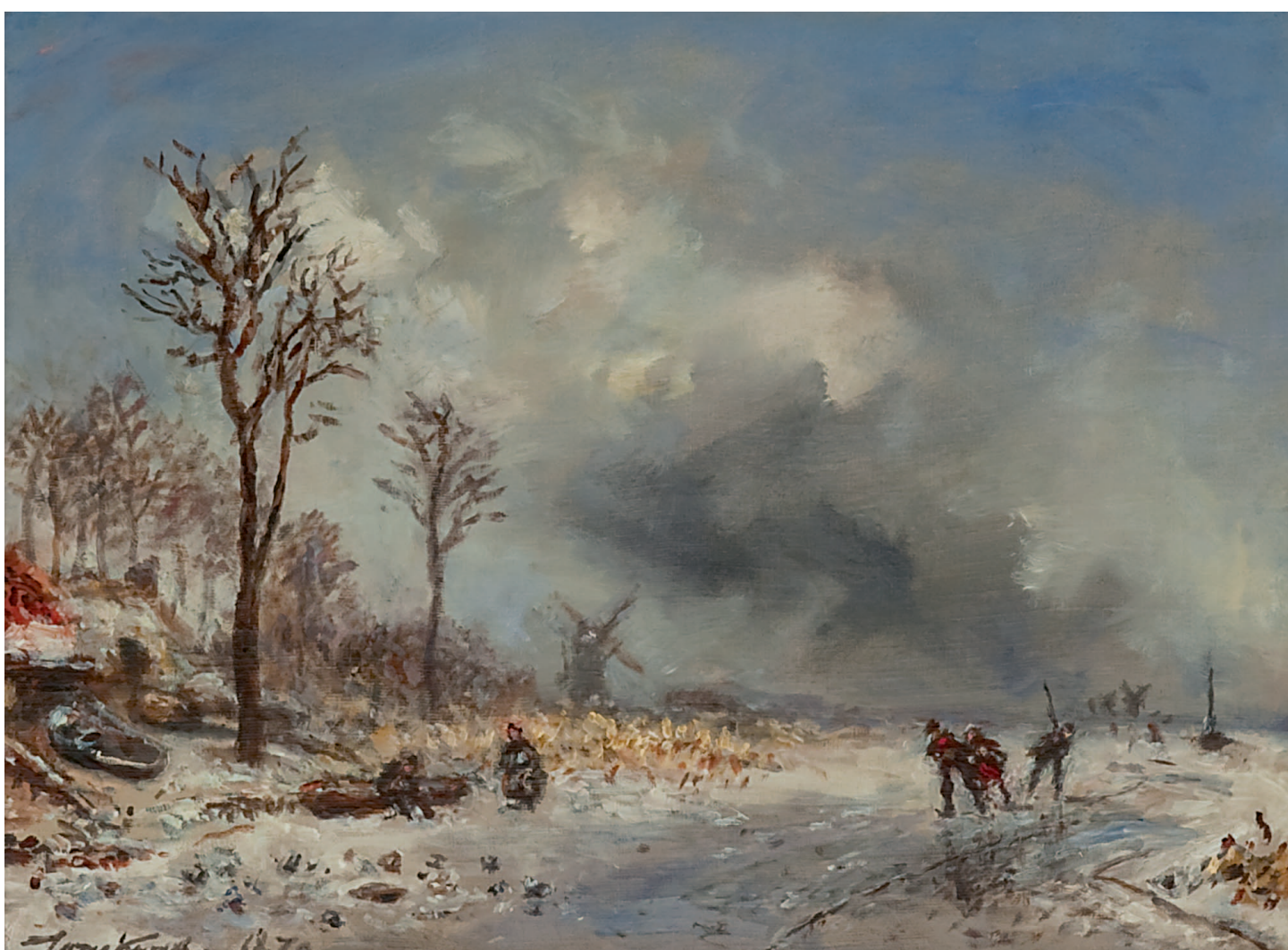
Johan Barthold Jongkind Schaatsers in de omgeving van Rotterdam