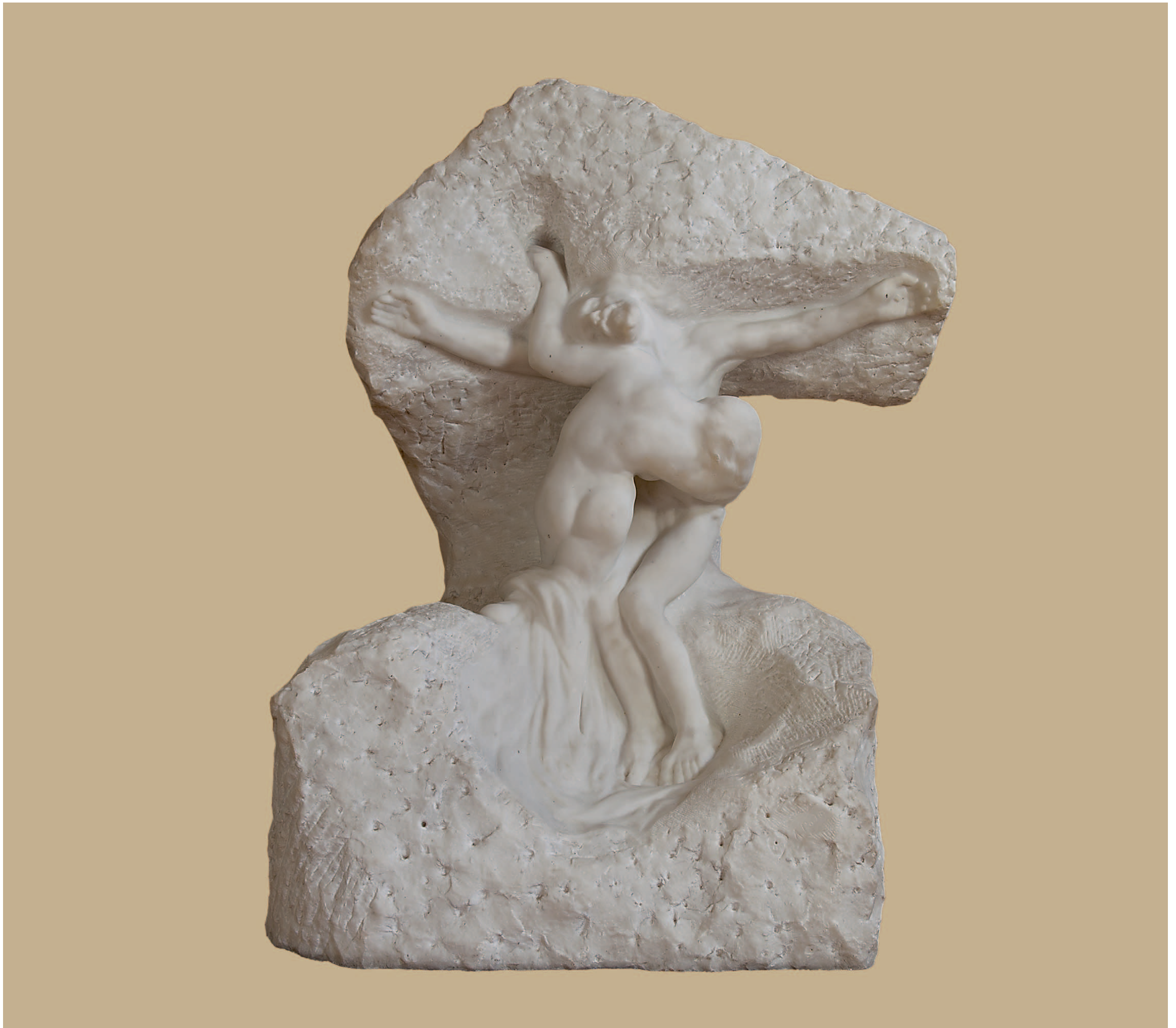
François 'Auguste' René Rodin Le Christ et la Madeleine

François 'Auguste' René Rodin Parijs 1840-1917 Meudon (Frankrijk) Le Christ et la Madeleine marmer 110 x 81 x 78 cm; gesigneerd en te dateren 1908-1909.