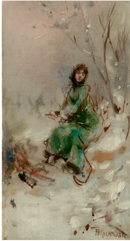
JANUARI – sterrenbeeld Steenbok