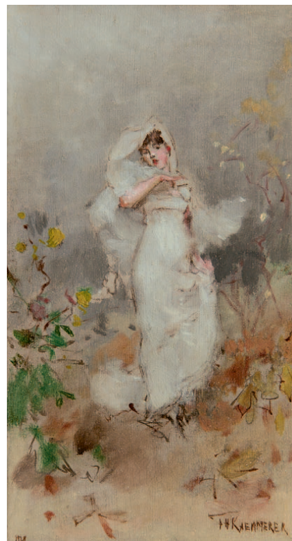
NOVEMBER – sterrenbeeld Schorpioen