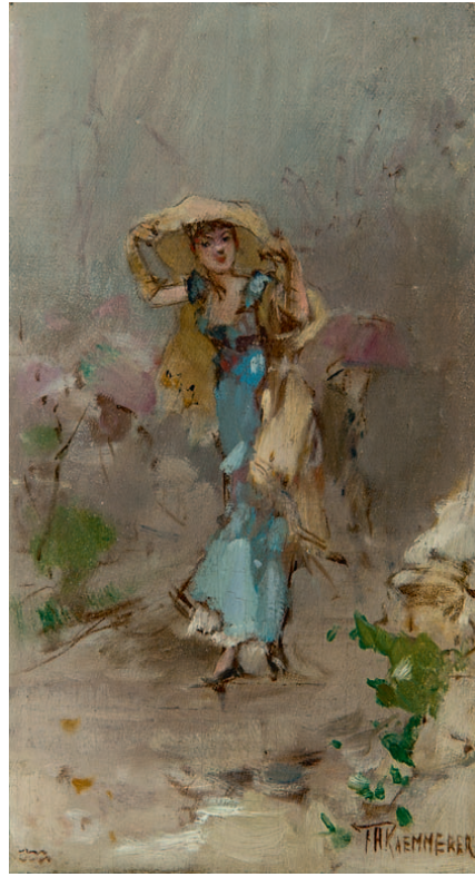
FEBRUARI – sterrenbeeld Waterman