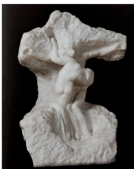
De versie in het Museo Thyssen-Bornemisza, Madrid.